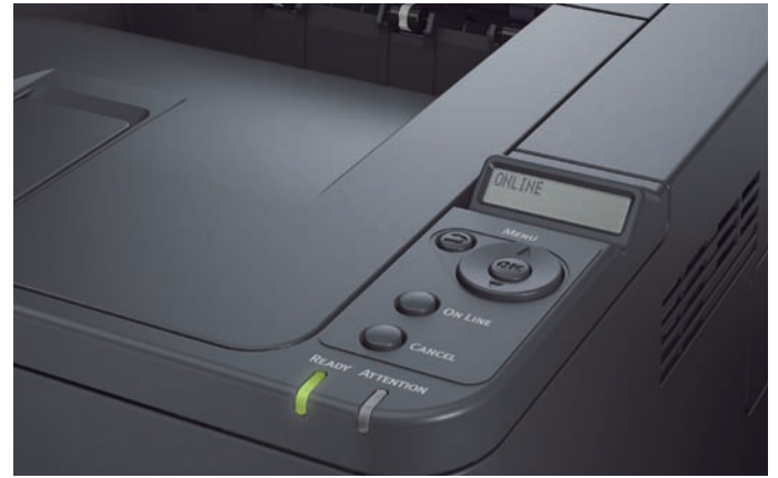
Panel del operador de la B431d/dn: Visor de LCD de 2 renglones de 16 caracteres; fácil acceso al estado de la impresora y a las funciones del menú a través de botones grandes y claramente marcados (disponible también a través del controlador de la impresora en la PC 5 )