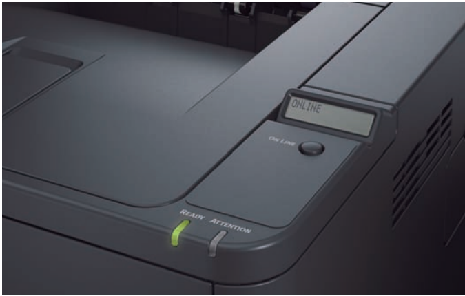
Panel del operador de la B411d/dn: Visor de LCD de 2 renglones de 16 caracteres; acceso al estado de la impresora y a las funciones desde un controlador (driver) en la PC